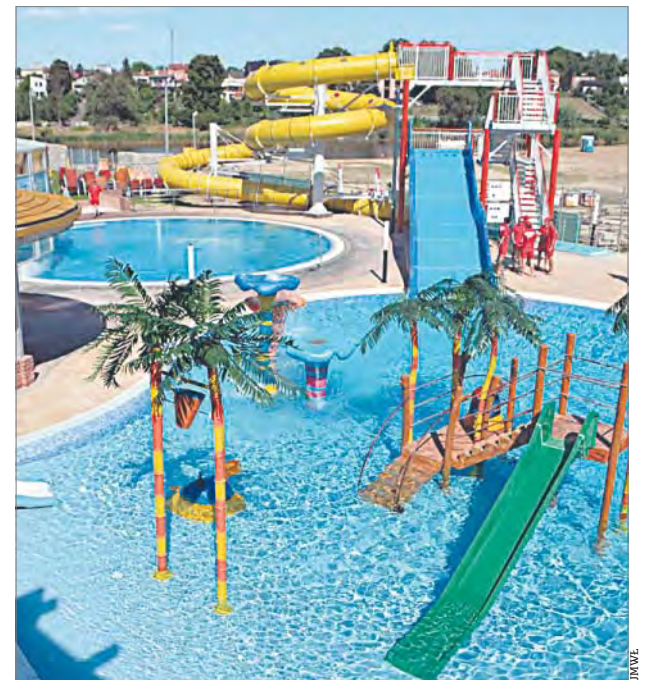
Termy uniejowskie to sztandarowa, kilkietapowa inwestycja gminy

Umowy te sprawiły, że Uniejów utrzymał I miejsce w kategorii gmin miejskich i miejsko-wiejskich z 2012 r. – osa