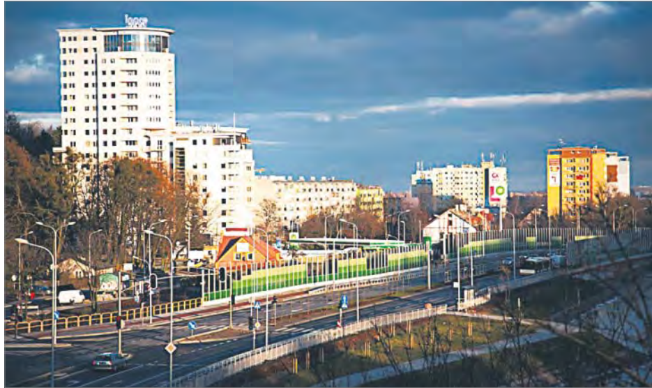
Trasa Słowackiego w Gdańsku

W ubiegłym roku, co przelożyło się na sukces w rankingu „Rz”, Gdańsk podpisał kolejne cztery umowy o dofinansowa-